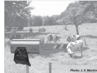
A consommer sans modération