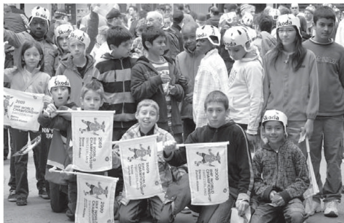
La course d'école de la classe 5/6 de Coteau-Fleuri (Assister à un match de CM de hockey sur glace à Kloten)

Jeudi 30 avril 2009, nous sommes partis à 7h30 de la gare de Lausanne pour Zurich. Nous sommes arrivés là-bas à 10h.