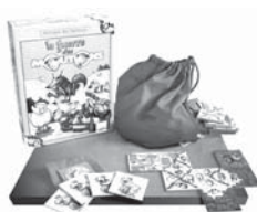
Jeu de la «Guerre des moutons»

Une équipe de sept bénévoles se relayent pour vous accueillir tous les mardis, sauf pendant les vacances scolaires, de 16h à 18h. Vous y trouverez un vaste assortiment de jeux d'éveil, de société, d'extérieur, mais également des jeux de logique, de stratégie, ou éducatifs. Que vous ayez 0 ou 99 ans, vous trouverez votre bonheur dans notre caverne d'Ali-Baba. Une cotisation de 15 francs est demandée par famille et par année, la durée