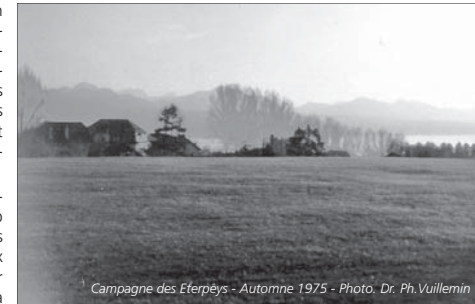
Campagne des Eterpeys - Automne 1975

Le bâtiment d'angle a permis l'ouverture d'une boulangerie bien fréquentée. Et pour la petite histoire, sachez qu'à la location, il y avait tellement de candidatures pour l'attique qu'un tirage au sort fut organisé pour son attribution!